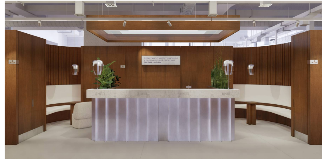
Фактуры и текстуры

Проект офиса Департамента инвестиционной и промышленной политики Москвы Архитектурная концепция офисного пространства для Департамента инвестиционной и промышленной политики города Москвы разработана с учетом принципов гибридного формата работы и строгого функционального зонирования. Основная задача проекта — создать эффективную среду, сочетающую закрытые кабинеты для сосредоточенной работы и открытые зоны для коммуникации, сохраняя при этом высокий уровень репрезентативности, характерный для государственных структур.